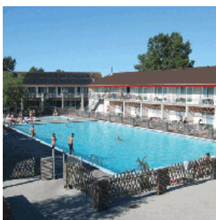
Kommandørgården - Rømø

Herefter går turen til Møgeltønder og videre til Kommandørgården på Rømø, hvor dagen afsluttes med aftensmad og overnatning.