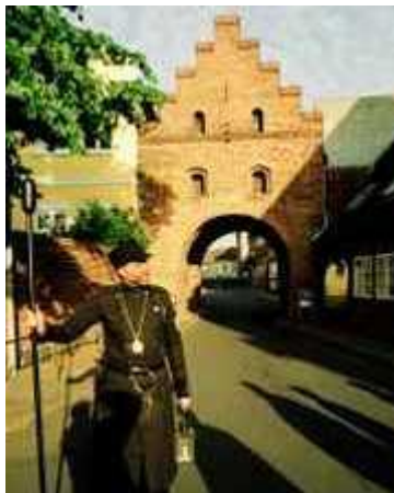
Vesterport - Fåborg