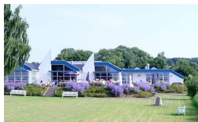
Hotel Fåborg Fjord