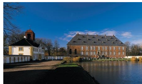
Valdemar slot – Tåsinge