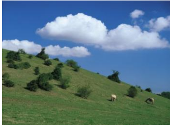
De Langelandske israndstrøg

Herefter går turen mod det Nordjyske, med et enkelt ophold for at spise aftensmad, inden forventet hjemkomst ca. kl. 20.30